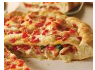
Chicken bacon stuffed