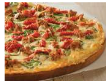
Spicy fennel sausage